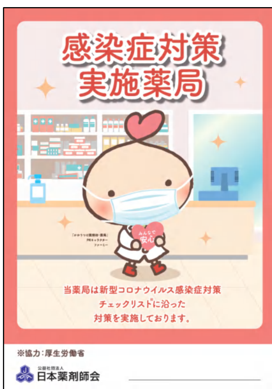
みんなが安心マーク

本会が作成する同マークについては、「薬局内における新型コロナウイルス感染症対策チェックシート【第二版】」及び「薬局内における新型コロナウイルス感染症対策チェックリスト」(項目は別紙3を参照)の全ての項目を実践していることを自己確認の上、同マークとともに「薬局内における新型コロナウイルス感染症対策チェックリスト」を掲出することで使用が可能となっている。